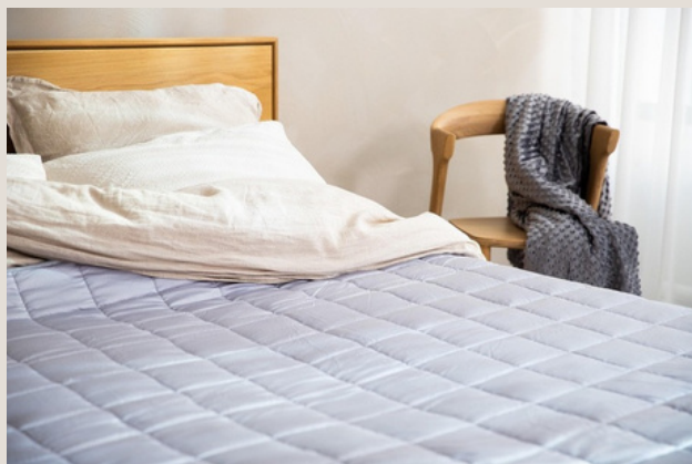
Dessus de lit / Jeté de lit

Ils y a autant de possibilités que de projets, contactez nous pour bénéficier de nos conseils sur mesure.