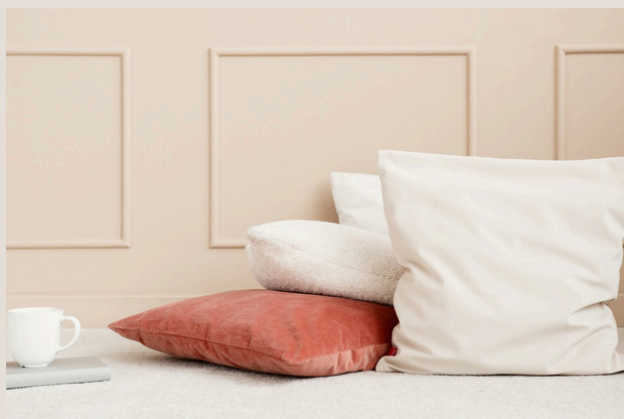
Housse de coussin